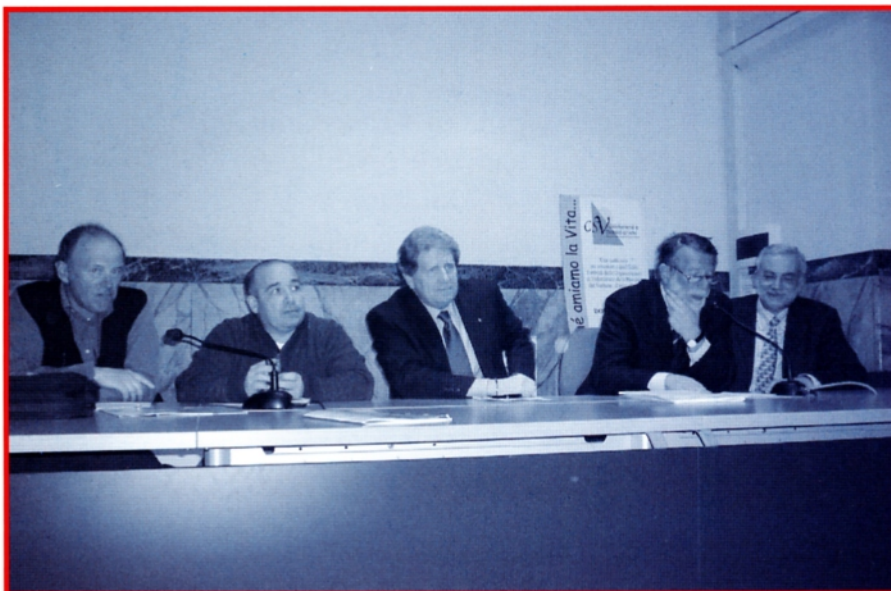
Il tavolo della Presidenza

La differenza è dovuta quasi totalmente alle maggiori spese effettuate per la festa del donatore che ammontano infatti a euro 65.775. Premesso che la nostra sezione ha un importantissimo ruolo sociale sul territorio, una missione che deve continuare per il bene della collettività, passiamo ora brevemente in rassegna quanto è accaduto nel corso del 2007.