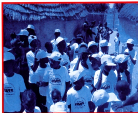
Il gruppo di bambini mentre ringrazia l'Avis