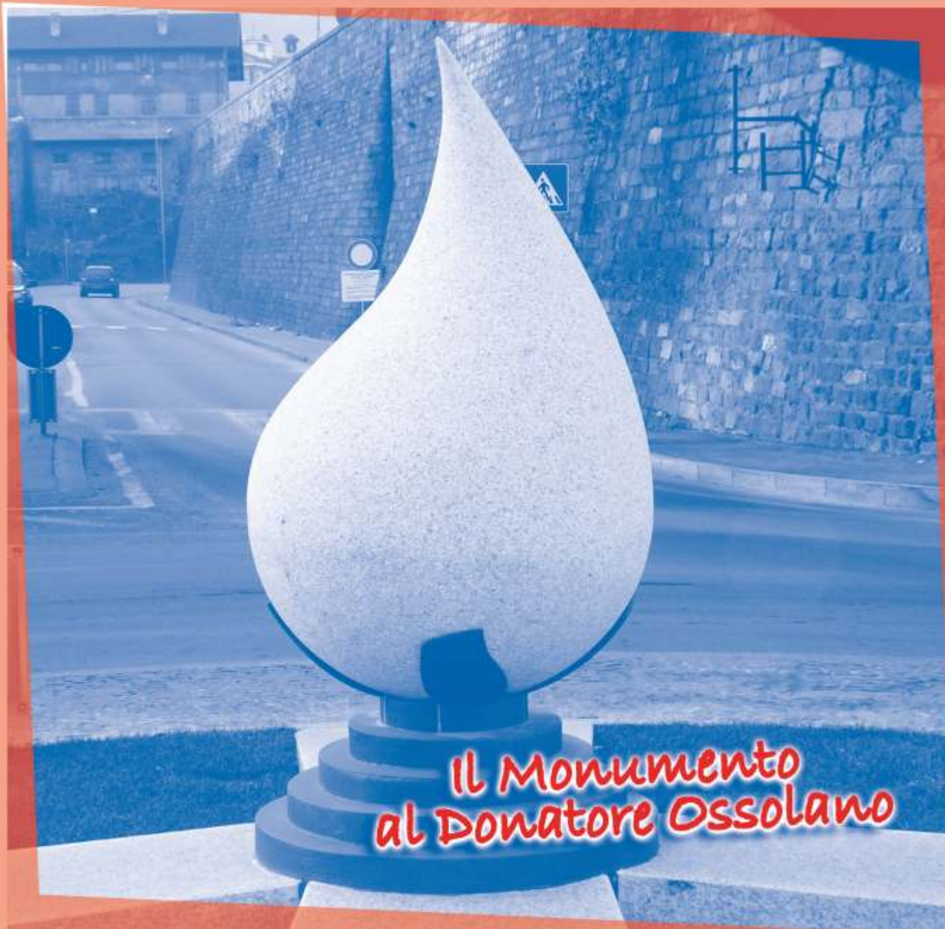
IL MONUMENTO AL DONATORE OSSOLANO

• ASSEMBLEA DEI SOCI • (in ultima pagina)